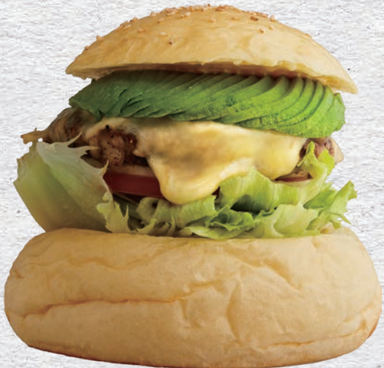
AVOCADO MOZZARELLA CHEESE BURGER