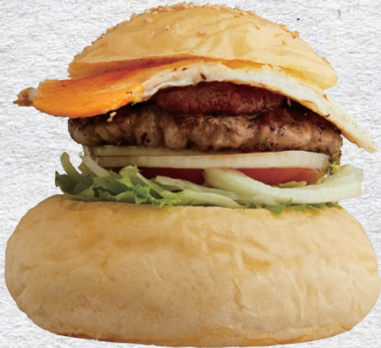
BBQ EGG BURGER