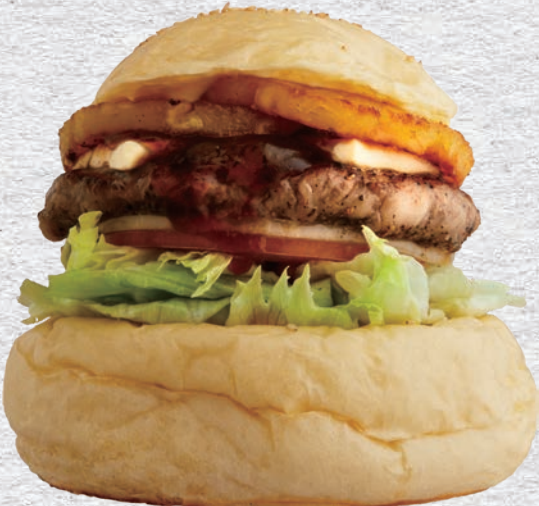
PINEAPPLE TERIYAKI CREAMCHEESE BURGER