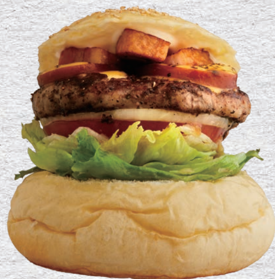
SPECIAL SMOKY BURGER

CREAM CHEESE BURGER 1330YEN (1463) STANDARD BURGER+CREAM CHEESE