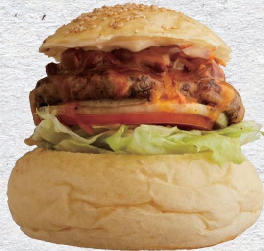
CHILIBEANS CHEESE BURGER

CHEDDAR CHEESE BURGER 1330YEN (1463) STANDARD BURGER+CHEDDAR CHEESE