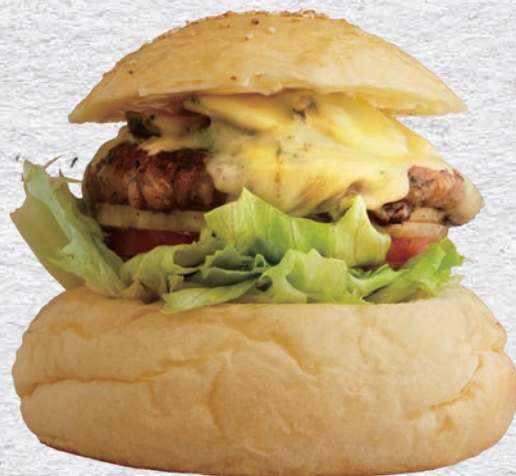
BASIL MUSHROOM CHEESE BURGER

PEANUTS BANANA BURGER 1450YEN (1595) STANDARD BURGER+PEANUTS BUTTER CREAM+BANANA